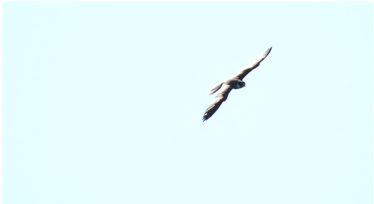
Auch Falkenartige wie der Baumfalke ziehen über die Alpen